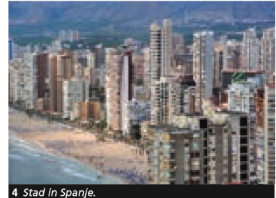
4 Stad in Spanje.