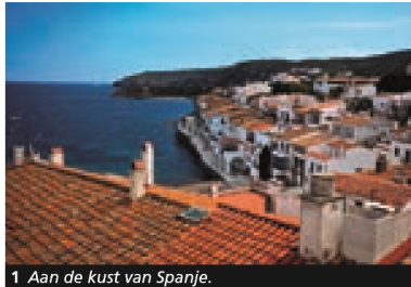
1 Aan de kust van Spanje.

In het vorige hoofdstuk leerde je over Tweede Wereldoorlog in Europa. Tegenwoordig kunnen we vrij reizen door datzelfde Europa. Wandelen over de grenzen in Limburg. Of door bergen in Zwitserland, langs rivieren in Nederland, de rotskusten in Engeland, eindeloze vlaktes in Hongarije. Deze cursus gaat over de vele landen en gebieden in Europa.