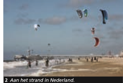
2 Aan het strand in Nederland.